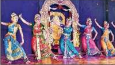
కళాకారుల నృత్య ప్రదర్శన