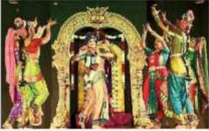
'జల వైకుంఠం' నృత్యరూపకం